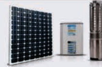
SISTEMAS RURALES Y AGRICULTURA